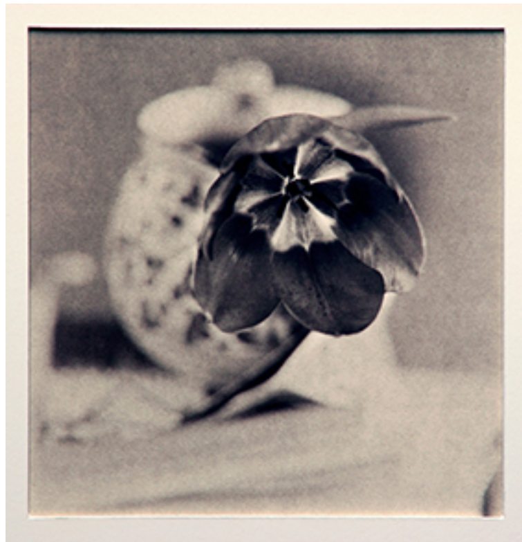
purificazione edition of 7 .20 x 20 cm platinum palladium print

Segnalo anche nel 2014 la personale “Purificazione” presso la Fondazione Luciana Matalon di Milano. Ho presentato una serie di nudi realizzati a metà degli anni novanta in pellicola e stampati poi in digitale e una serie di Still life degli anni 2000, scattati in pellicola negativa e proposti in stampa con un particolare processo analogico Platinum Palladium Print.