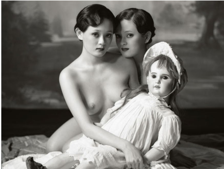
twin bambole edition of 5 90 x 90 cm moab entrada rag natural

“ Pelle di donna Identità e bellezza tra arte e scienza” nel 2012 alla Triennale di Milano dove ho partecipato al viaggio tra arte e bellezza.