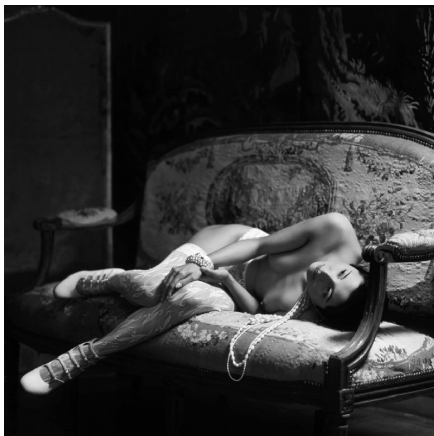
petali d'oriente edition of 5 90 x 90 cm canson fine art infinity platine fibre rag

Sei un artista a 360° gradi, ti piace sperimentare, studiare ed esprimerti in numerosi settori. Hai lavorato anche per importanti testate e riviste. Qualche servizio che descriva il tuo stile?