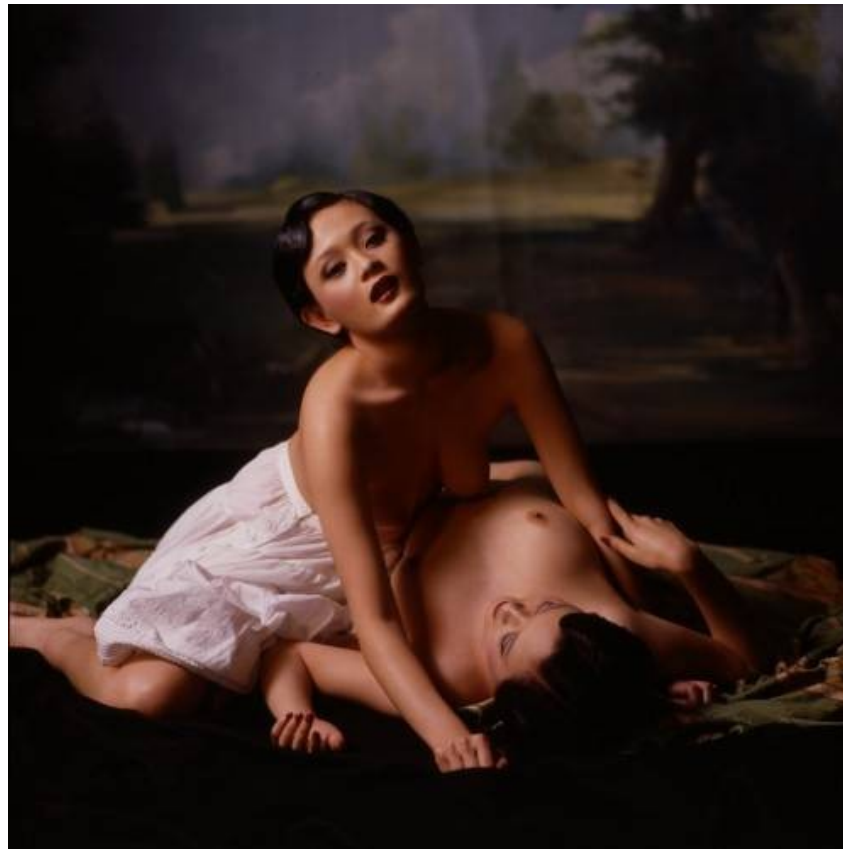
L'immagine vincitrice del concorso